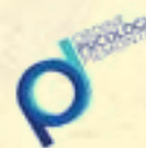
Ordine degli Psicologi del Piemonte