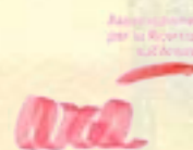
Associazione per la Ricerca sull'Ansia